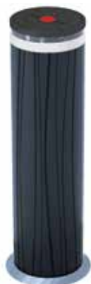
JS 48 R